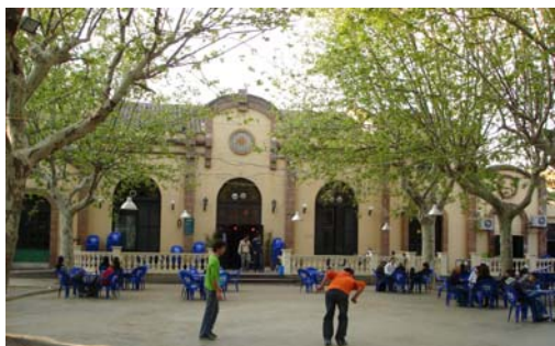
L'Artesà un lloc de tots, en perill.