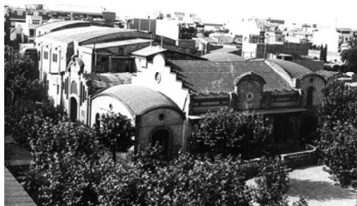
L'edifici construït en 6 mesos

El teatre del Centre Artesà es va aixecar en 6 mesos, la primera pedra és posada el 30 de març de 1919 i la inauguració el 27 de setembre, primer dia de la Festa Major, va funcionar com a teatre, sala de ball i de cinema, fins l'any 1987 quan l'Ajuntament el va llogar iniciant-se l'abandó actual.