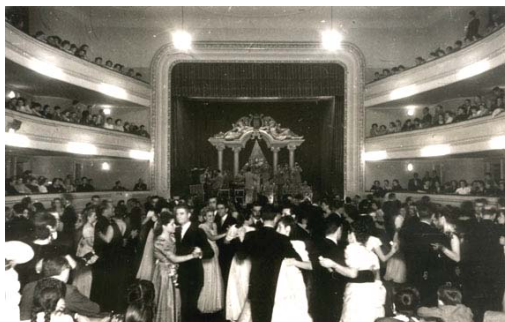
Un lloc pel ball, pel cine i pel teatre